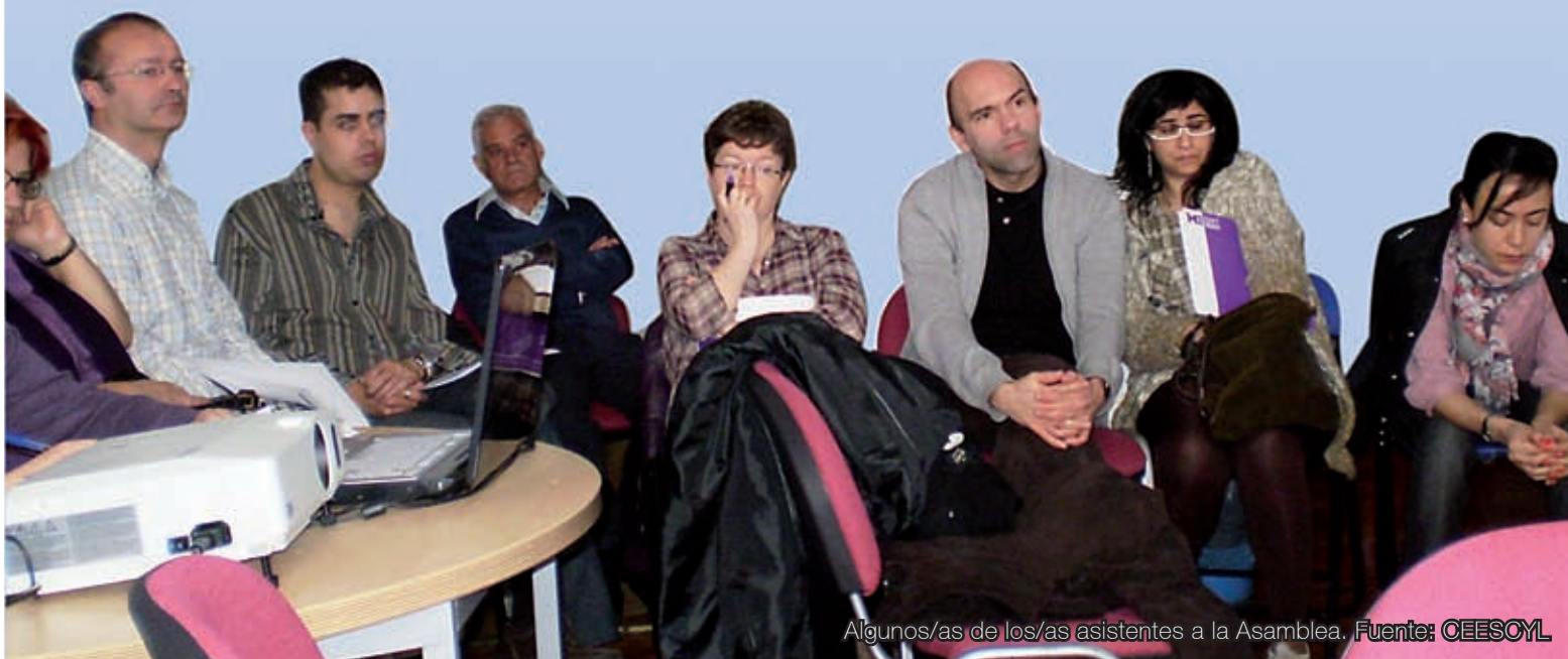
Algunos/as de los/as asistentes a la Asamblea.

La información sobre el desarrollo de esta Asamblea y los documentos aprobados puedes consultarlos en la zona de acceso exclusivo a colegiados/as del colegio.