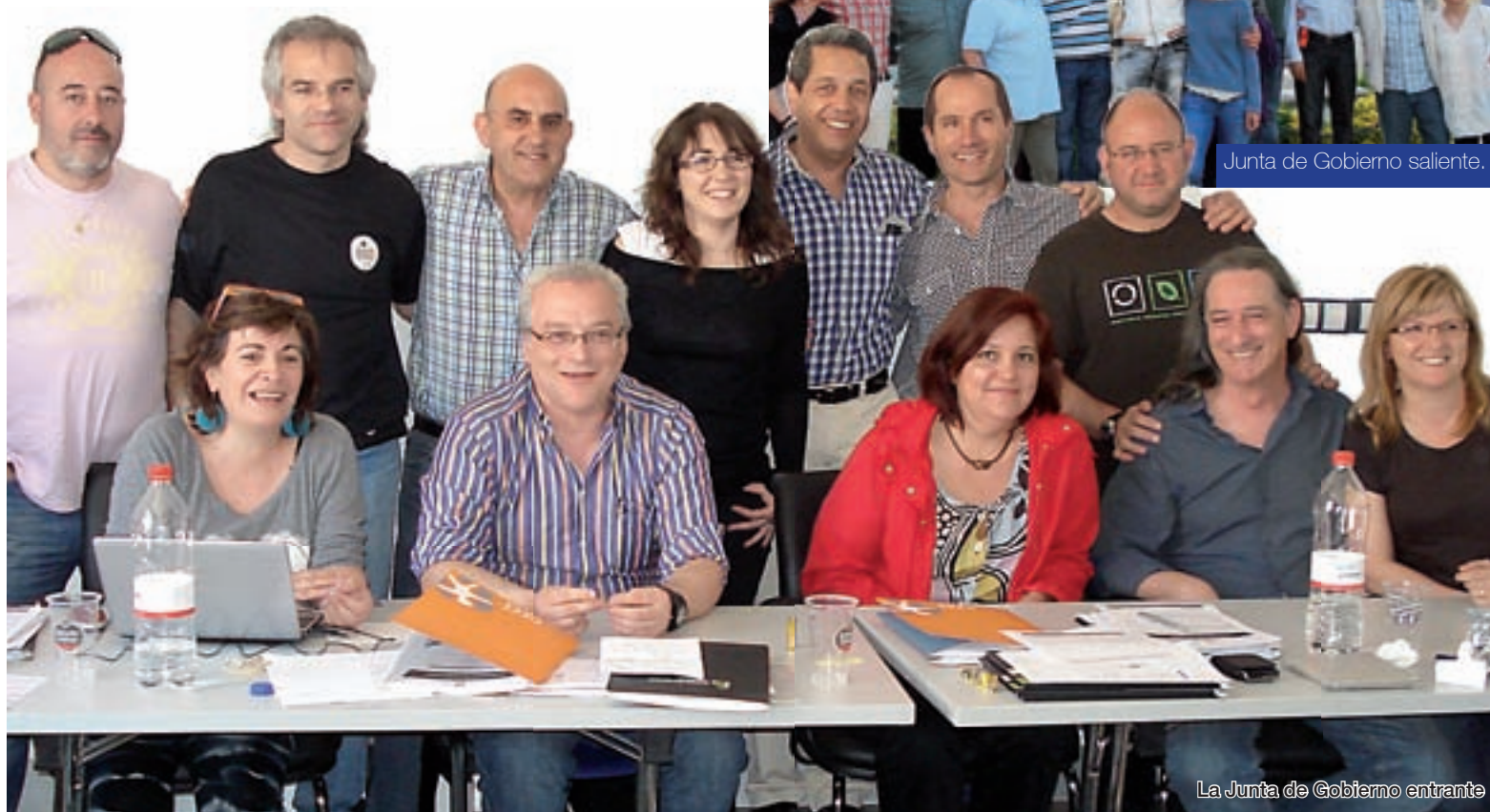
La Junta de Gobierno entrante