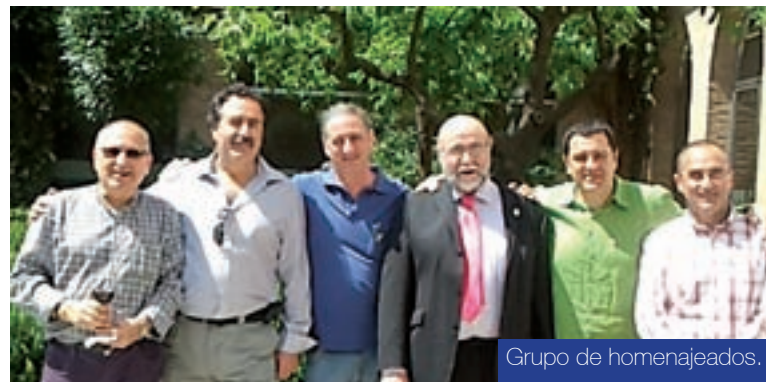
Grupo de homenajeados.