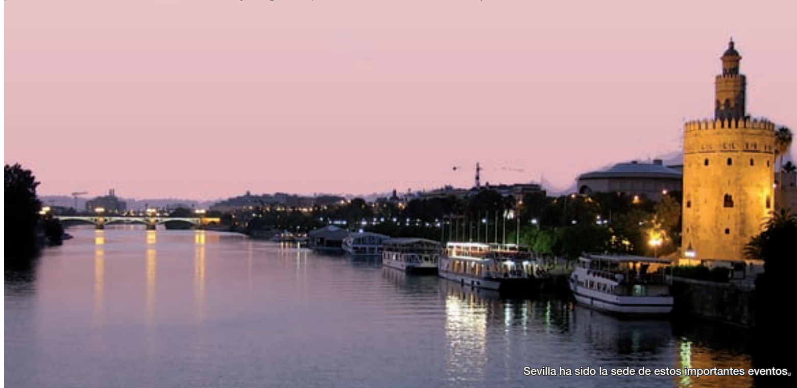
Sevilla ha sido la sede de estos importantes eventos.

Por otra parte, también se acordaron las bases para la organización, durante 2011, del I Concurso Estatal de Proyectos de Educación Social. Esta información comenzará a difundirse a partir del mes de junio, con el objeto de que desde los diferentes colegios autonómicos y asociaciones profesionales se presente experiencias autonómicas innovadoras, en los diferentes ámbitos de la educación social.