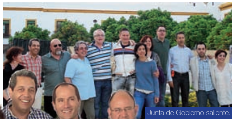
Junta de Gobierno saliente.