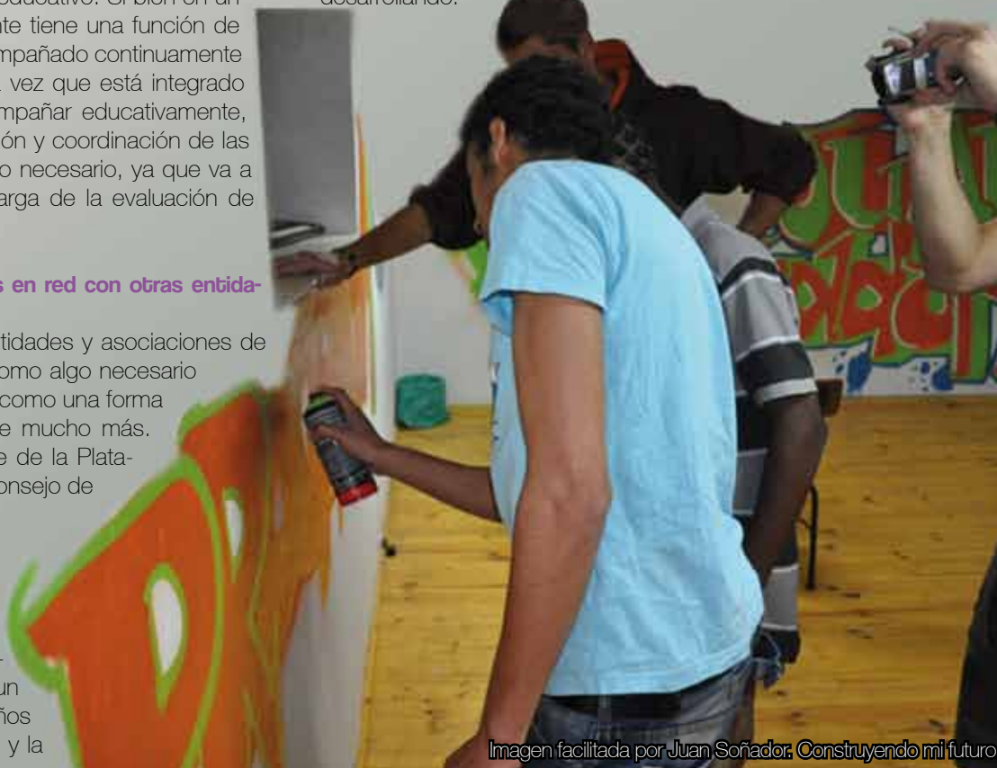
Construyendo mi futuro.

Fundación espera que el Plan recoja el pensamiento estratégico y que sea una herramienta que marque el rumbo, pero que a su vez se dote al producto final de carga operativa: indicadores y cuadro de mando. La metodología que se está empleando tiene un enfoque participativo y distributivo. Sobre todo en León vemos necesario el desarrollo e impulso del ámbito de la orientación laboral. También necesitamos dar mayor estabilidad a alguno de los proyectos que ya se vienen desarrollando.