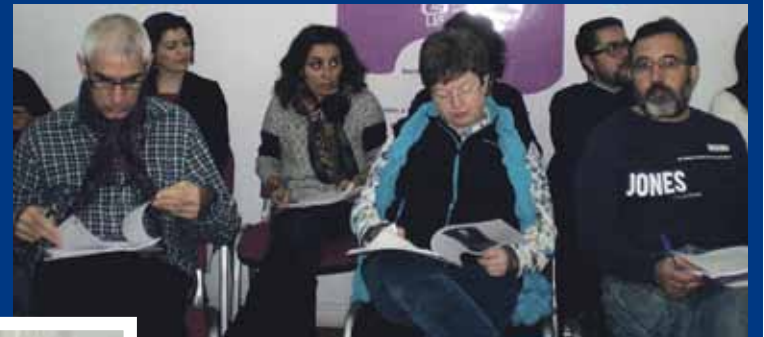
Asamblea General del pasado 22 de febrero

Por otro lado, el polémico anteproyecto de ley de servicios y colegios profesionales volvió a ponerse encima de la mesa. La Junta Directiva recordó de qué manera afectará éste al colectivo profesional e insistió en que puede implicar cambios a nivel profesional, puesto que una persona que no sea Educador Social podrá ejercer como tal si la colegiación no se establece como obligatoria. Respecto al ámbito de firma de convenios, se ratificó el de colaboración entre la entidad Plan B Educación Social y el recientemente acordado con la Facultad de Educación Social y Trabajo Social de la Fundación Pere Tarrés.