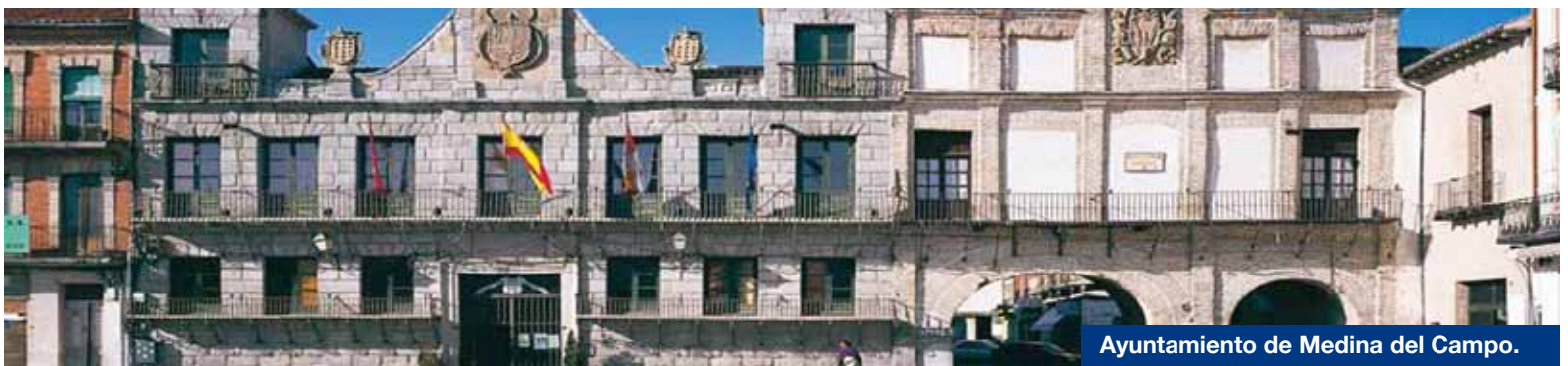
Ayuntamiento de Medina del Campo.

El CEESCYL quiere recordar que un Educador Social es un profesional habilitado para el diseño, implementación y evaluación de programas y planes socioeducativos dirigidos a la prevención o a la intervención en distintos ámbitos; entre ellos el de drogodependencia. Por ello, seguirá informando a sus colegiados sobre futuras acciones jurídicas que garanticen el respeto por la Educación Social y eviten el intrusismo profesional en cualquier organismo.