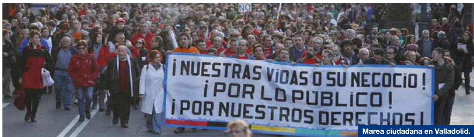
Marea ciudadana en Valladolid.

Hasta ahora el CEESCYL ha recibido respuesta tanto desde el PSOE como del Consejero de Presidencia de la Junta de Castilla y León, en la cual ambos han manifestado su predisposición a colaborar en nuestra propuesta. Asimismo, en lo que respecta al ámbito académico, el Rector de la Universidad de Burgos ha declarado su apoyo a la iniciativa, mientras que el Rector de Salamanca ha manifestado su apoyo en el desarrollo de instrumentos legales que permitan desarrollar profesionales más competentes y mejor capacitados.