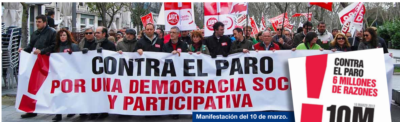
Manifestación del 10 de marzo.

La Cumbre Social y, por tanto, CEESCYL, exigen a la política que retome su condición de herramienta para las personas.