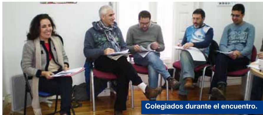
Colegiados durante el encuentro.

Se estableció un debate en el que se manifestó la preocupación por el descenso del número de colegiados en los últimos meses.