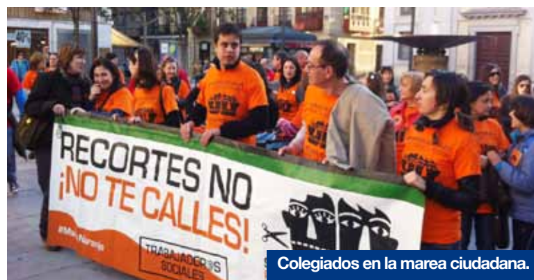
Colegiados en la marea ciudadana.

La Marea Naranja (de la que CEESCYL forma parte) unió su voz a la del resto de mareas que, en un acto conjunto, salieron a la calle el pasado 21 de marzo en Valladolid para rechazar de pleno las políticas de recortes llevadas a cabo por el Gobierno Central y para reivindicar una sociedad más digna, justa e igualitaria. Por un día, los intereses de los distintos ámbitos profesionales (Sanidad, Educación, Cultura, Medio Ambiente...) aunaron sus voces en esta Marea Ciudadana repetida en toda España con cuyo fin común se identifica plenamente el Colegio de Educadores y Educadoras de Castilla y León. Además, como profesionales del ámbito social, CEESCYL considera