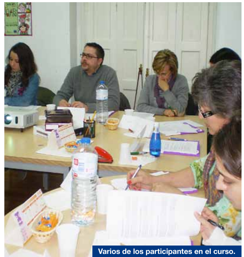
Varios de los participantes en el curso.

Gracias a los recursos y el material ofrecido, los participantes pudieron intervenir y debatir en un ambiente distendido y dinámico, especialmente durante el trabajo práctico. Fruto de ello es la satisfacción general de los asistentes, que han formado ya un grupo de contacto mediante el que, a partir de ahora, podrán intercambiar conocimientos, informaciones y experiencias relacionadas con la Educación Social.