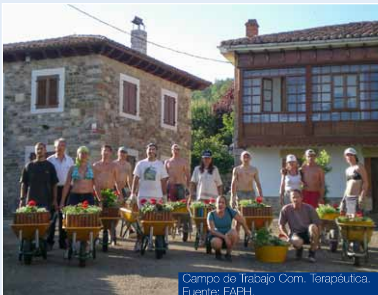
Campo de Trabajo Com. Terapéutica.