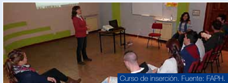
Curso de inserción.