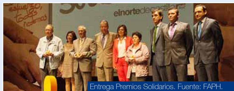
Entrega Premios Solidarios.