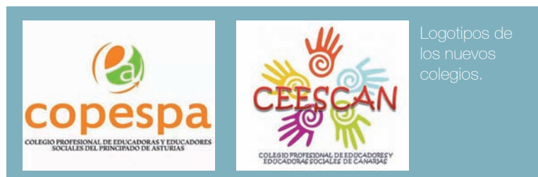
Logotipos de los nuevos colegios.

El archipiélago canario también cuenta ya con Colegio profesional,