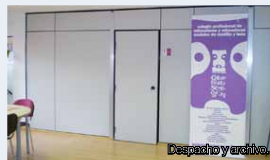
Despacho y archivo.