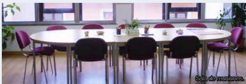
Sala de reuniones.