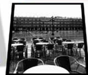
3º premio: "Sin plaza"