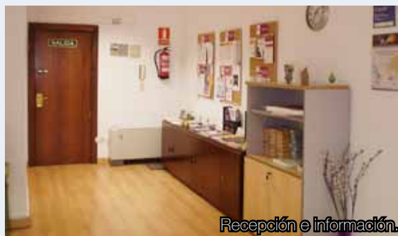
Recepción e información.