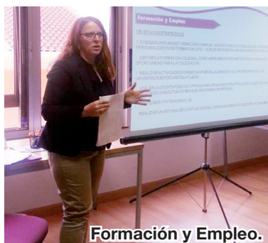
Formación y Empleo.

La Asamblea acordó realizar una auditoría interna de las cuentas del CEESCYL para cumplir los estatutos, que exigen que se haga una, toda vez que la Junta de Gobierno cambie, parcial o totalmente.