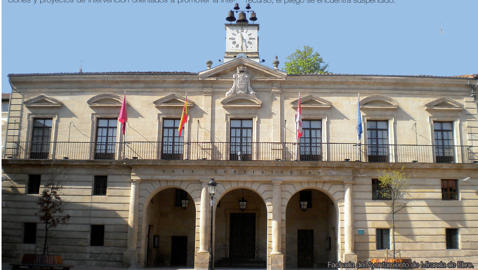
Fachada del Ayuntamiento de Miranda de Ebro.

gración de personas pertenecientes a minorías étnicas a través de talleres de prevención e intervención social, apoyo individual y familiar, prevención del absentismo escolar y prevención comunitaria. Sin embargo, para su implementación, solicitaba la contratación de un Diplomado en Trabajo Social. Desde el CEESCYL entendemos que todas estas actuaciones son propias de la Educación Social. Por este motivo, en primer lugar se contactó con la persona de referencia del pliego para tratar de corregirlo. Tras no obtener respuesta alguna, el CEESCYL ha presentado el pasado 14 de mayo un recurso de reposición a este pliego. A fecha de hoy y hasta que se valore el recurso, el pliego se encuentra suspendido.